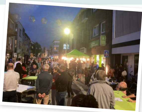
Zuiders terras in Beveren

Op het digitaal inspiratieplatform van de Provincie Oost-Vlaanderen kan je nog meer voorbeelden vinden.