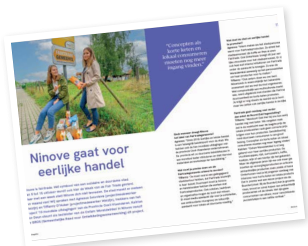
Uitgebreid artikel over eerlijke handel in het infoblad van de Stad Ninove

Op het digitaal inspiratieplatform van de Provincie Oost-Vlaanderen kan je nog meer voorbeelden vinden.