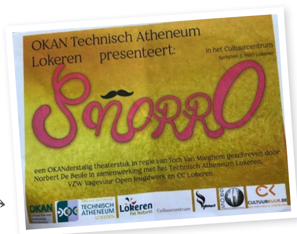
Voorstelling OKAN in het Cultureel Centrum in Lokeren

Op het digitaal inspiratieplatform van de Provincie Oost-Vlaanderen kan je nog meer voorbeelden vinden.