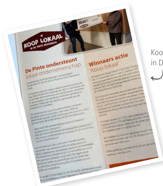
Koop lokaal actie in De Pinte

Op het digitaal inspiratieplatform van de Provincie Oost-Vlaanderen kan je nog meer voorbeelden vinden.