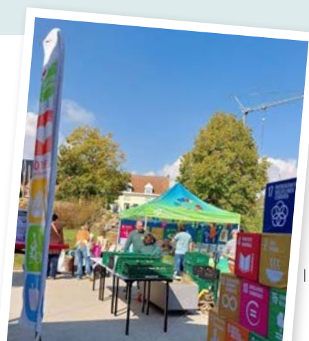
Faire Boerenmarkt in Lierde

Op het digitaal inspiratieplatform van de Provincie Oost-Vlaanderen kan je nog meer voorbeelden vinden.