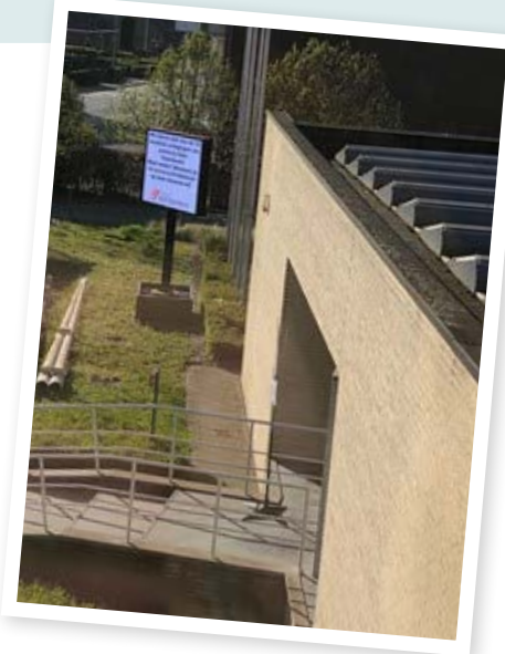
↻ Aankondiging 10 mondiale uitdagingen op lichtkrant van de gemeente Wachtebeke

Op het digitaal inspiratieplatform van de Provincie Oost-Vlaanderen kan je nog meer voorbeelden vinden.